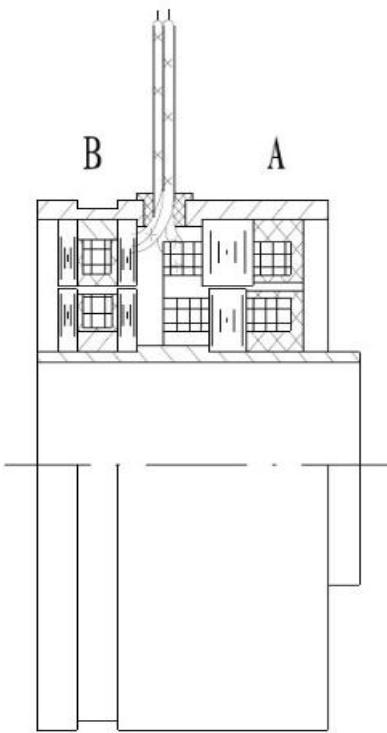
图 1、环形变压器式旋变结构示意图